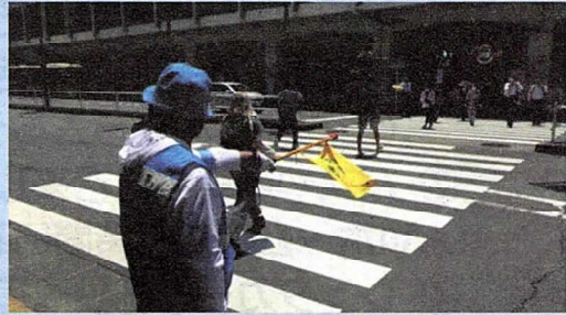
横断歩行者保護誘導活動