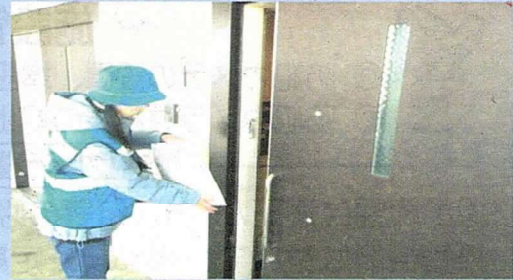
高齢者宅訪問活動