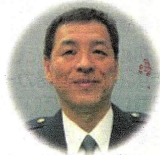
江沼町田警察署長

町田新聞販売同業組合(一部を除く)は、地域に密着した活動を推進しています。この様な防犯情報については是非、ご近所の皆様にお知らせください。本紙は、同組合の協力を得て皆様にお届けしています。(裏面もご覧ください)