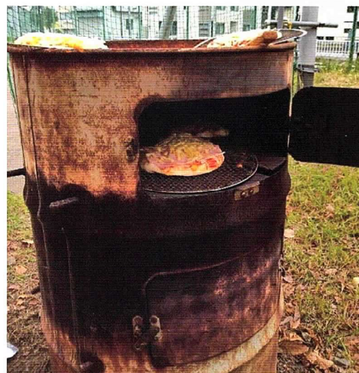
ドラム缶のピザ窯