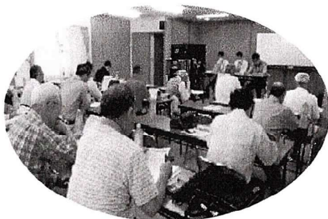
第1部「町田市 都市づくり部 交通事業推進課」による 「延伸に向けた取組みについて」の説明会の映像