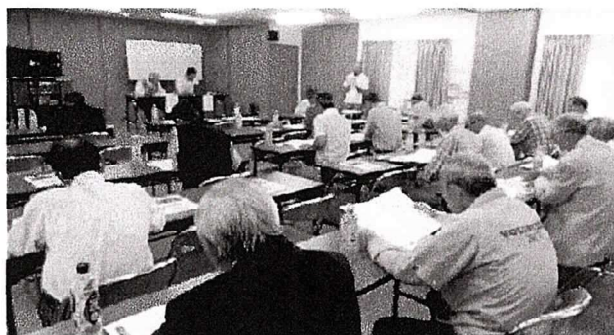
第2部令和6年度定期総会 審議中の映像