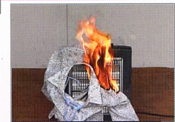
例 電気ストーブに衣類が落下し出火

連日空気が乾燥しており、火災の発生しやすい状況が続いています。どうぞ火の元には十分にお気をつけください。 昨年、町田消防署管内では、火災によりお亡くなりになられた方が4名発生しております。 住宅火災をなくすため、皆さま一人お一人のご理解とご協力をよろしくお願いします。