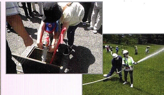
スタンドパイプを使用した放水訓練