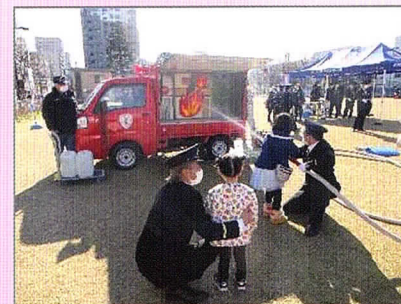
まちかど防災訓練車での放水訓練

新年度の自治会活動を計画する際には、防火防災訓練の実施についても、ぜひご検討ください。例えば…、初期消火訓練をするにあたって、『まちかど防災訓練車』や『スタンドパイプ』などの様々な資器材を活用した実践的な訓練が可能です。 引き続き、感染防止対策に配慮した防火防災訓練を実施いたしますので、ご要望があれば、ぜひ一度ご相談ください！