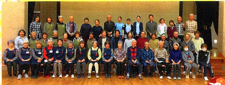
2022年12月5日「自主グループ交流会」にて