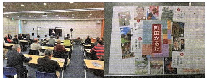
(オンライン防犯講習会)

3月6日午後2時より、町田警察署の協力のもと、「特殊詐欺」防止をテーマに防犯講習会を開催しました。今回の講習会は、コロナ対策として、市庁舎3階会議室、忠生市民センター地域活動室、小川会館の3か所の会場をリモートで結ぶ方式で行われました。