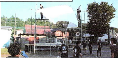
足場を組んでスクリーンの準備

台風一過の青空が広がる土曜日の午後、〇にオの字のロゴ入りTシャツを着たオヤジの会の面々が集合。準備開始。大型スクリーン設置のための足場は高さ10メートル、幅8メートルぐらいか。鉄骨を下から上へと組んでいく。昨年の経験もあり、手際が良い。グラウンドには、密にならないために3メートルごとにテープを張る。ご近所さんには、音と光でご迷惑をおかけするお詫びとご理解をお願いするチラシを配って歩く。