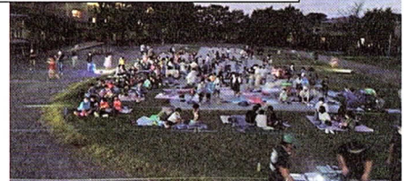
開演前 そろそろ暗くなってきました

ところが、映画が佳境に入った7時過ぎ、空模様が怪しくなり、稲光が走り出した。雷雨予想をキャッチした主催者が中止を告げる。慌ただしく解散した20分後には猛烈な雷雨となった。残念な終わりとなったが楽しい気分は子どもたちの心に残っただろう。