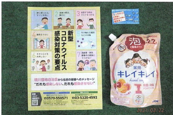
( 上写真は配布した3点 )

年明け早々、生活文化局に助成金申請書一式を郵送し、1月16日には交付決定通知書が送られてきました。さっそく準備にとりかかりました。助成金交付条件には指定された3つの配布物があり、全てを配布しないと最終的に交付には至りません。その一つがチラシです。生活文化局ホームページからダウンロードした原稿に自治会からの啓発コメントを入れ印刷屋に依頼し、1月22日にはチラシが届きました。