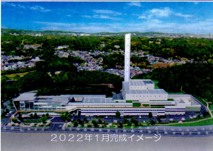
2022年1月完成イメージ

新しい施設は、2022年1月からの稼働を予定しており、現在のごみ焼却施設は新しい施設の稼働後に解体し、跡地は緑地となります。