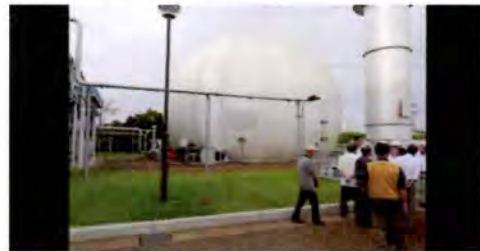
(メタンガスタンク)