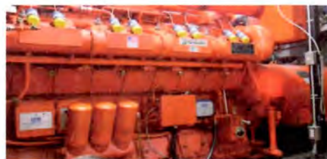
(ガスエンジン発電機)